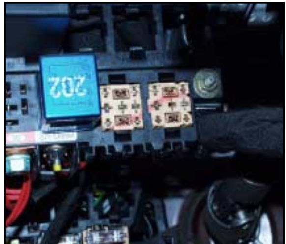
entferntes Relais, Sicht auf den Stecksocket