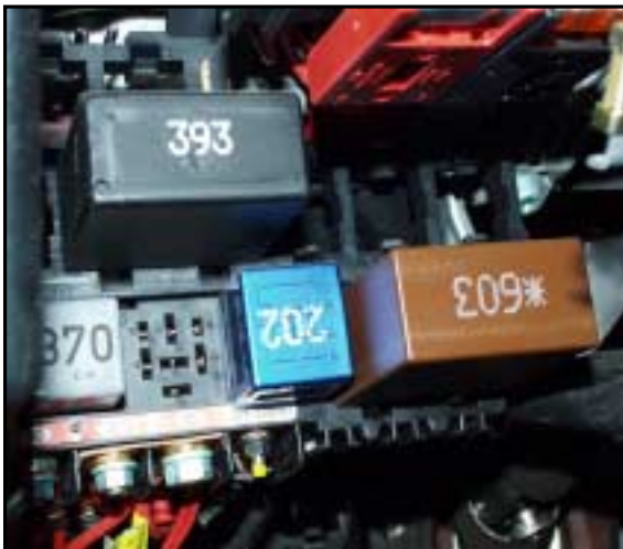
Check - Kontrollrelais *603

Dargestellte Abbildungen sind Fotomaterial, welches von uns fotografiert oder von Kunden zur Verfügung gestellt wurde. Sollte die Qualität bzw. die Darstellung nicht optimal sein, bitten wir um Nachsicht.