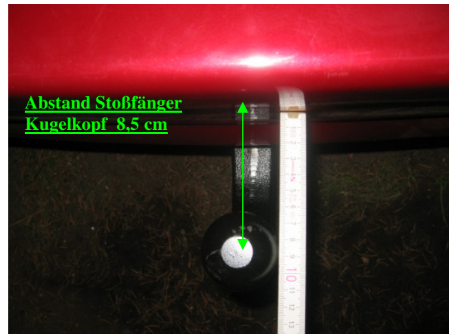
Abstand Stoßfänger Kugelkopf 8,5 cm