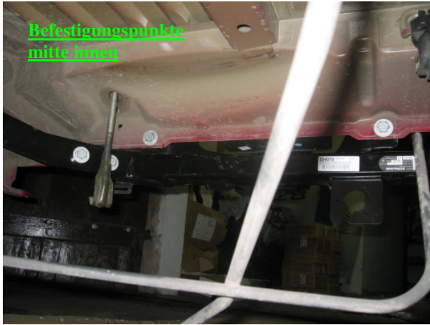
Befestigungspunkte mitte innen