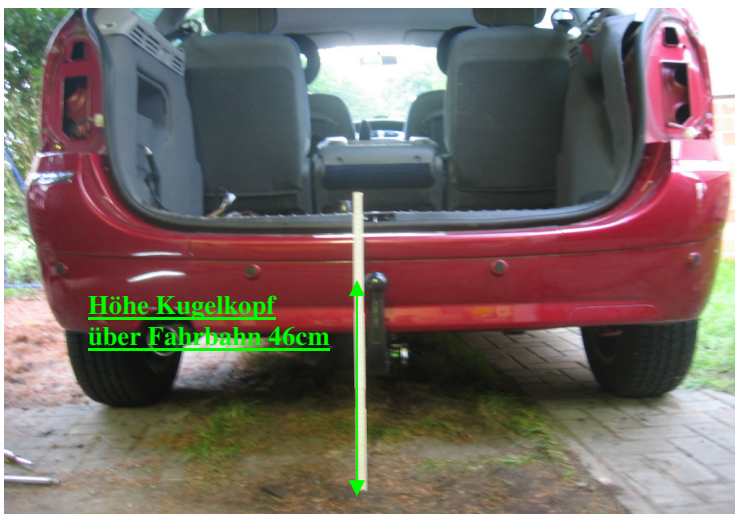
Höhe-Kugelkopf über Fahrbahn 46cm